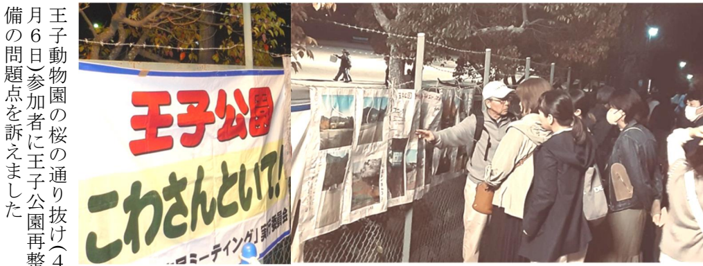
王子動物園の桜の通り抜け(4月6日)参加者に王子公園再整備の問題点を訴えました