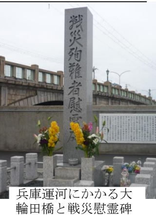
兵庫運河にかかる大輪田橋と戦災慰霊碑

燃えていました。幸い家の一角は焼け残り『バンザイ』と叫んだ。父も生きていた。6月19日の空襲にも合った。幸運にも生き延びたが、この経験を伝えたい」と話しました。 記録する会は「空襲体験を語り継ぐことは未来を守ること」として活動を進めます。6月には大倉山公園内の平和の碑に新たに判明した約20人の空襲犠牲者の名前を刻む刻銘追加式を行います。